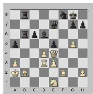
Trait aux noirs Borya Ider joue et gagne