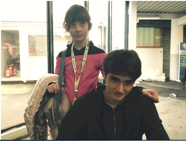
Les deux premières victoires en même temps et avec la manière !