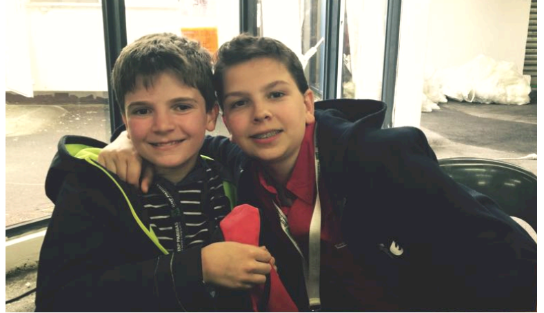
17h50 Victoire des deux compères !