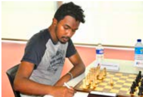
Fy : champion de France universitaire