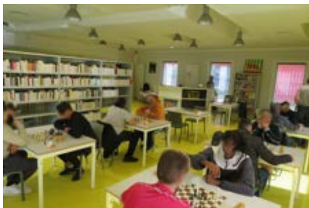
Concentration maximum devant l'échiquier